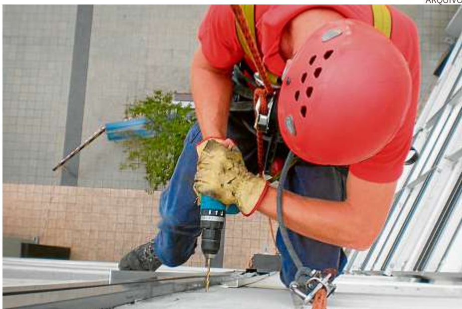
Manutenção de áreas comuns dos imóveis é bancada por taxa de condomínio